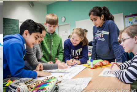
UNESCO Tage an der Schiller-Schule Bochum - Impressionen der Foto-AG