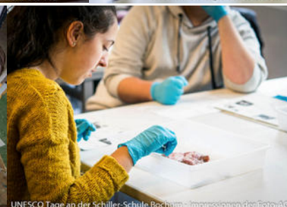
UNESCO Tage an der Schiller-Schule Bochum - Impressionen der Foto-AG