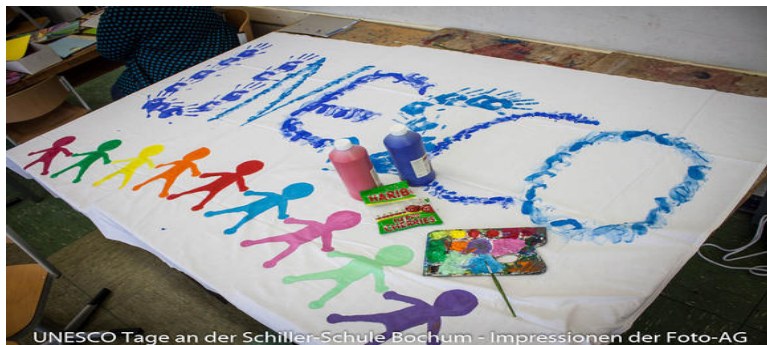
UNESCO Tage an der Schiller-Schule Bochum - Impressionen der Foto-AG