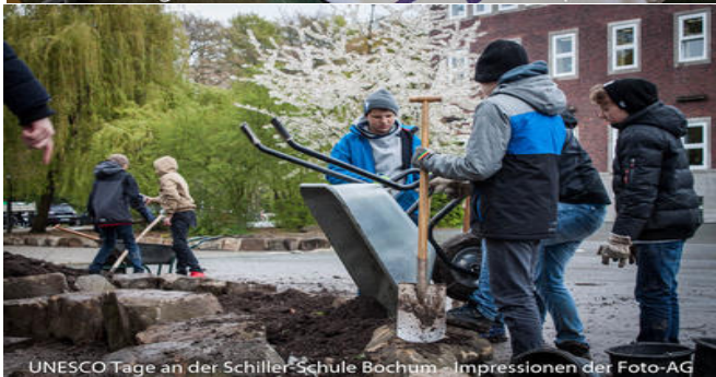
UNESCO Tage an der Schiller-Schule Bochum - Impressionen der Foto-AG