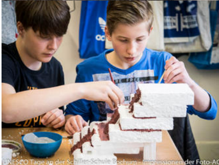
UNESCO Tage an der Schiller-Schule Bochum - Impressionen der Foto-AG