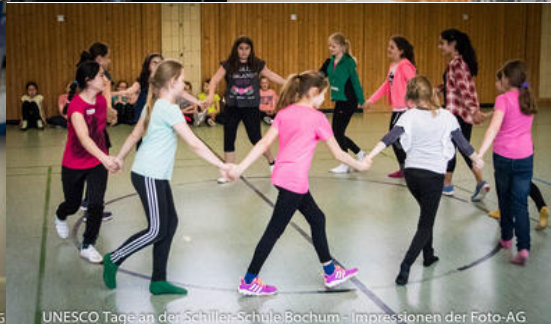
UNESCO Tage an der Schiller-Schule Bochum - Impressionen der Foto-AG