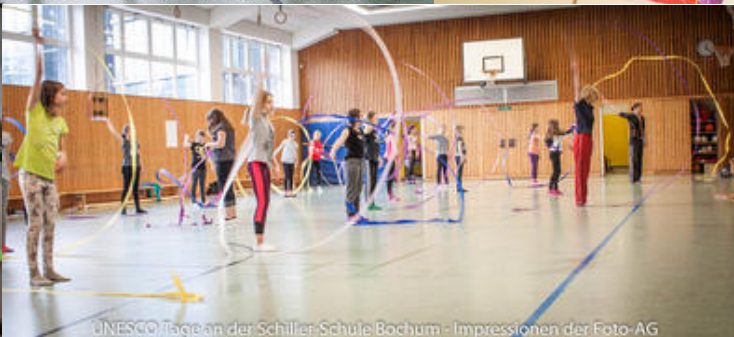
UNESCO Tage an der Schiller-Schule Bochum - Impressionen der Foto-AG