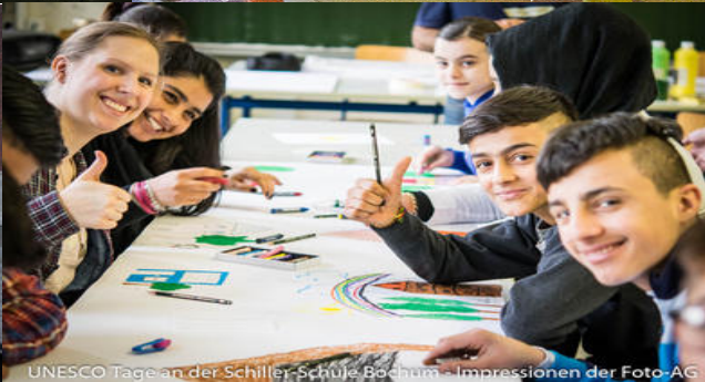
UNESCO Tage an der Schiller-Schule Bochum - Impressionen der Foto-AG