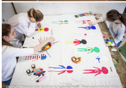
UNESCO Tage an der Schiller-Schule Bochum - Impressionen der Foto-AG