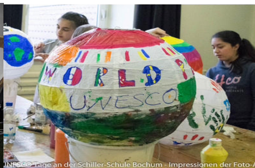
UNESCO Tage an der Schiller-Schule Bochum - Impressionen der Foto-AG